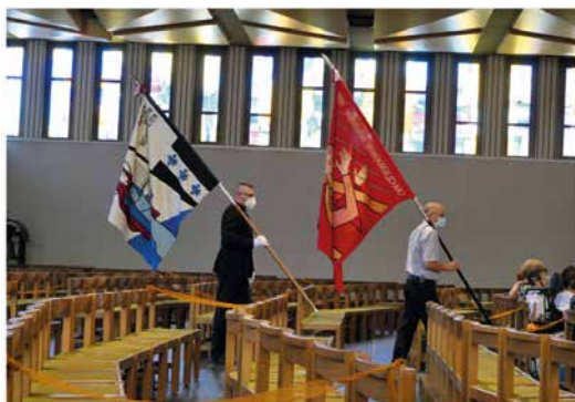
Die Fahndelelegationen aus den Wohnorten der feiernden Kinder

Wir freuen uns, am 1. Oktober 2021, mit dem neuen Dekan Ludovic Nobel einen Firmgottesdienst feiern zu können.